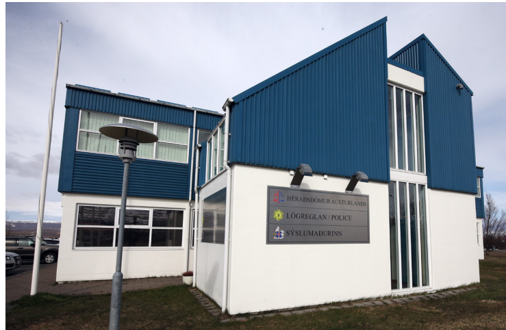
Málið var rekið fyrir Héraðsdómi Austurlands.

Stærri fyrirtæki eru yfirleitt með fasta lögmennt og sækja ráð til Samtaka atvinnulífsins eða annarra heildarsamtaka þegar ágreiningur