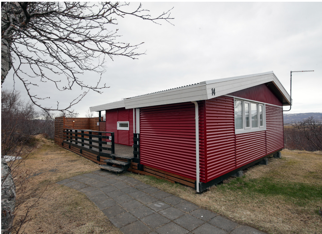
AFL á 15 hús á Einarstöðum.

Talsverðar skemmdir verða á innbúi og jafnvel húsunum sjálfum í svona uppákomum.