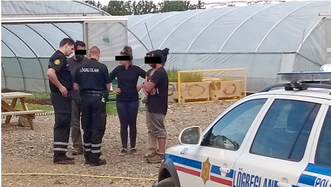
AFL hefur í gegnum tíðina látið lögreglu vita af málum þar sem grunur leikur er um einbvers konar nauðung.

Þá var fjallað um sjálfbodaliðastarf sem tíðkast á einstaka stöðum á svæðinu og jafnvel í efnahagslegri starfssemi – þ.e. við framleiðslu á neysluvöru eða sölu á þjónustu. Fyrirtæki sem notast við sjálfbodaliða eiga að greiða skatta að áætluðu verðmæti þeirrar vinnu sem þau fá án endurgjalds og sjálfbodaliðar eiga