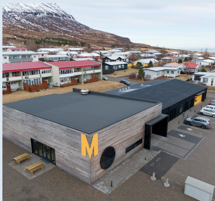
Samvinnuhúsið Múlinn í Neskaupstað.

Húsið verður væntanlega boðið til sölu næsta vetur.